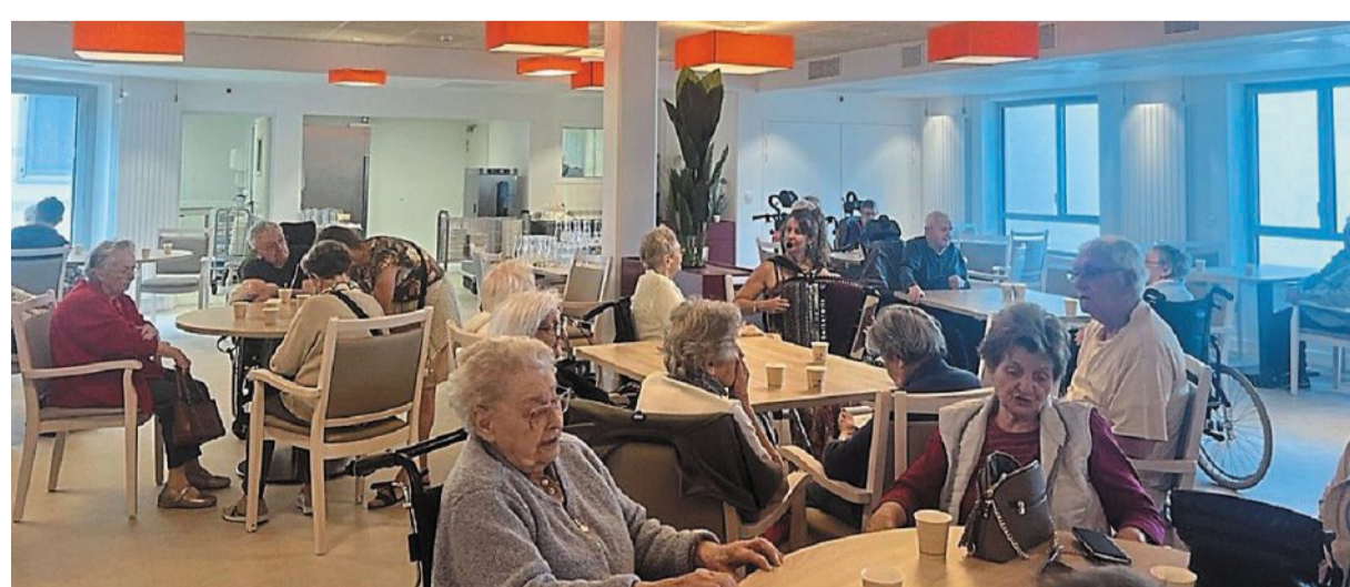
Un goûter avec une accordéoniste était organisé pour rassurer et divertir les résidents le temps de l'emménagement.