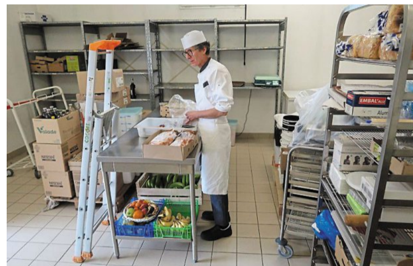
En cuisine, les personnels gèrent les stocks et le transfert du matériel.