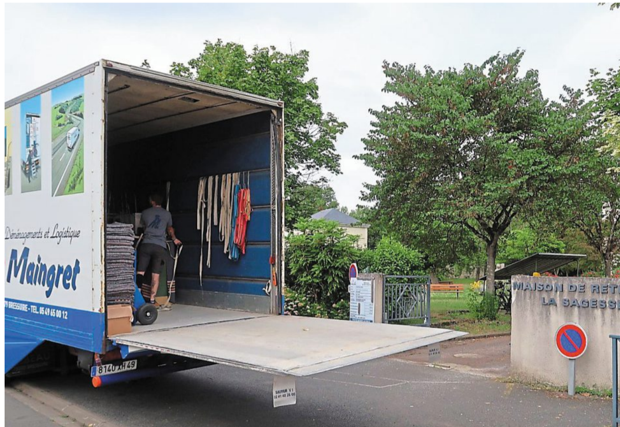
Saint-Lambert-des-Levées, mardi. Les déménageurs de la société Avizo ont prévu cinq jours pour assurer le transfert de La Sagesse vers la Croix-Verte.

En même temps que les résidents en somme, qui ont retrouvé leurs affaires dans leur nouvel environnement après avoir fait un petit tour de minibus pour parcourir les 1 500 m qui séparent les deux établissements. Pour ce faire, La Sagesse a bénéficié du soutien de structures partenaires comme l'Adapei, l'IME de Chantemerle ou la Maison d'accueil spécialisée des Romains, qui ont prêté des véhicules, conduits par les chauffeurs du transport soli-