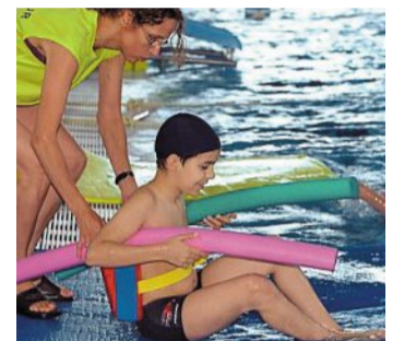
Quatre catégories d'apprentissage s'adressent aux enfants.